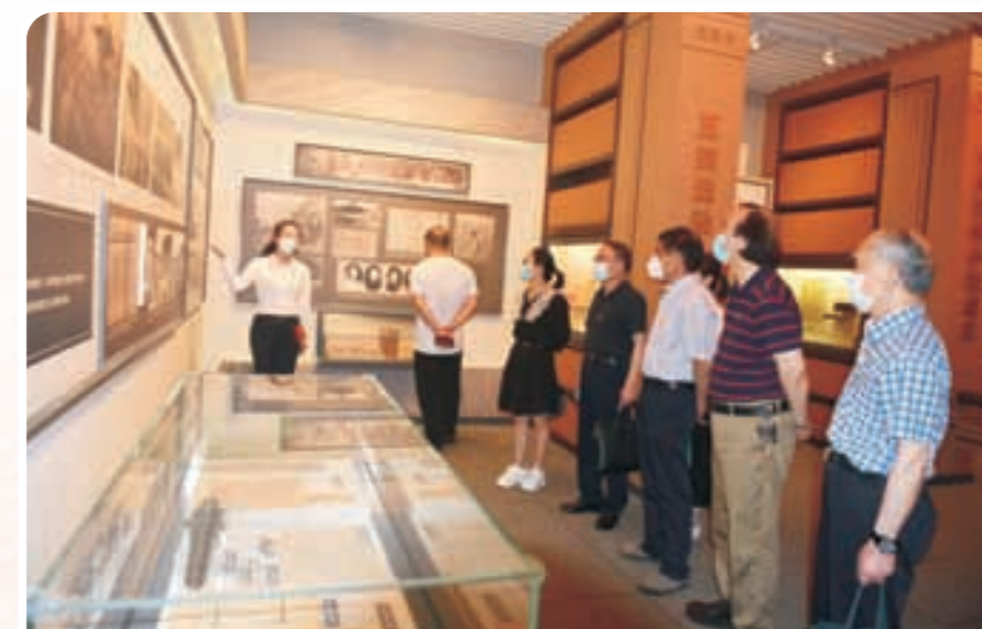
参观中国共产党杭州历史馆 ▶