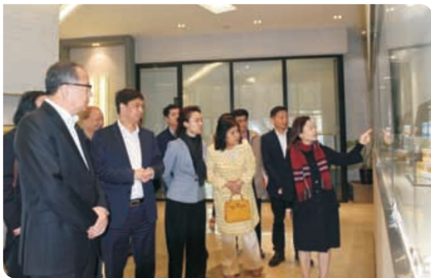
◀ 走访浙江我武生物科技股份有限公司