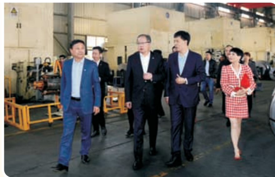
◀ 走访格兰德电气有限公司