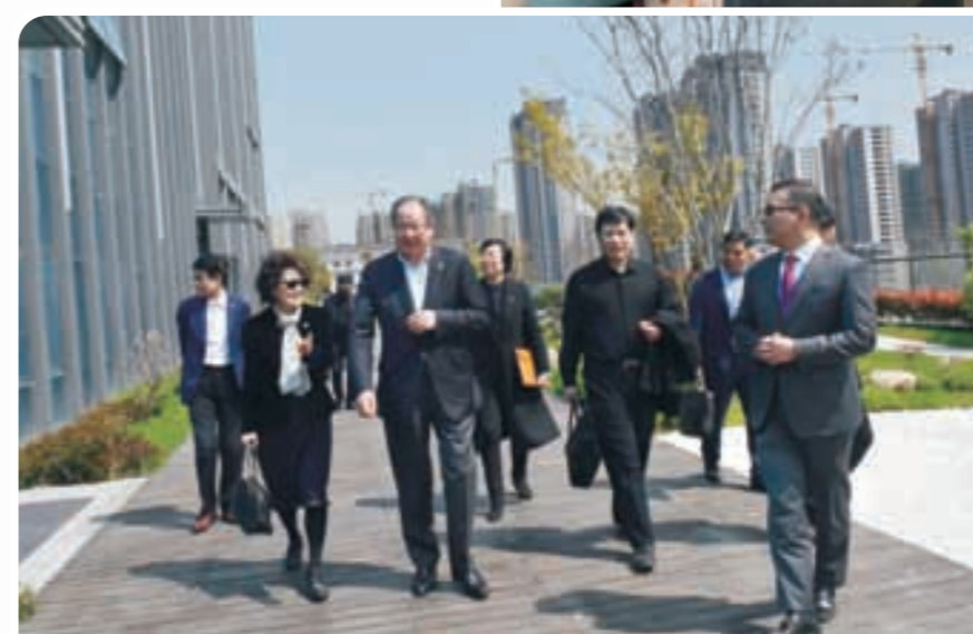
走访杭州康奋威科技股份有限公司