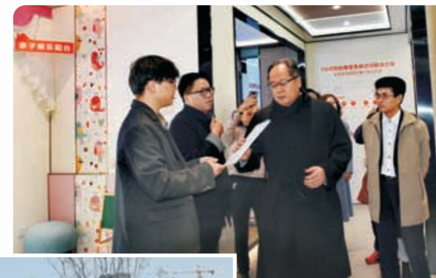
走访奥普家居股份有限公司