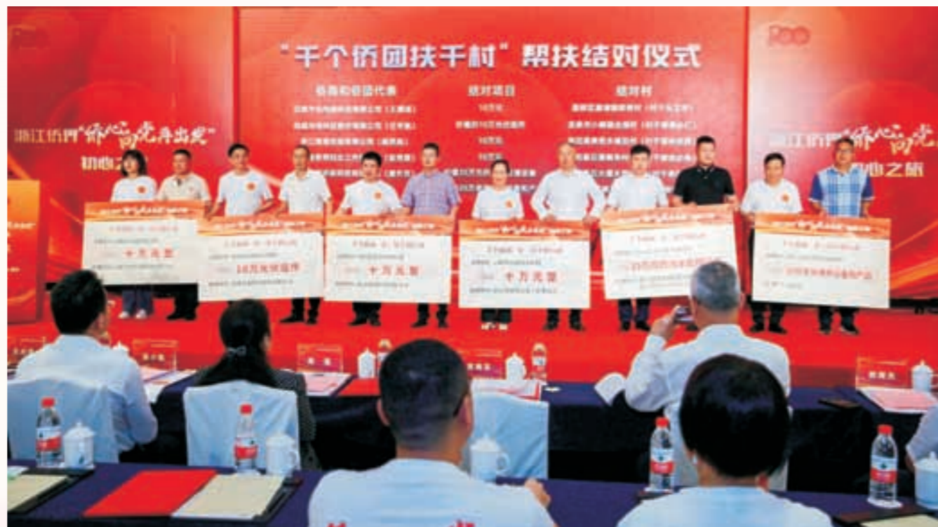
省侨商会多家会员与丽水乡村结对，为共谋乡村振兴、共推乡村富裕作贡献