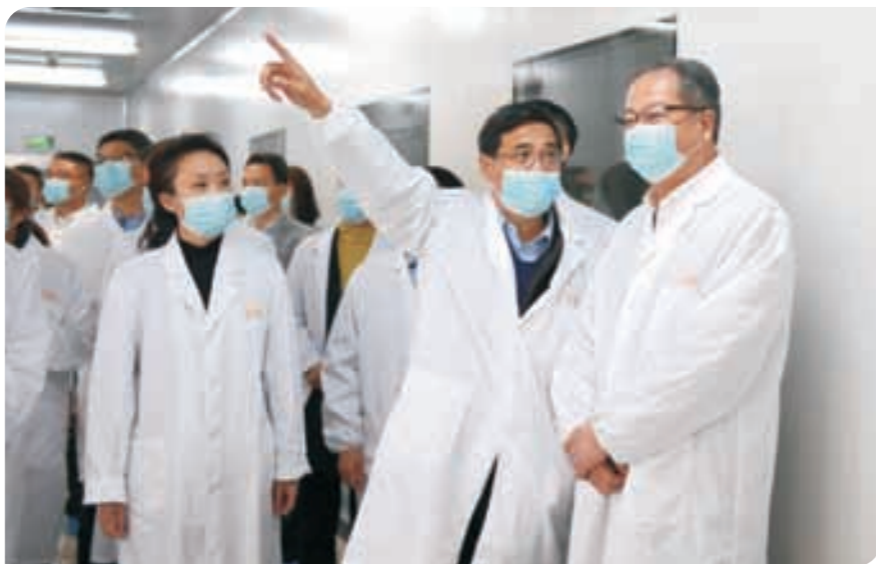
走访浙江金时代生物技术有限公司 ▶