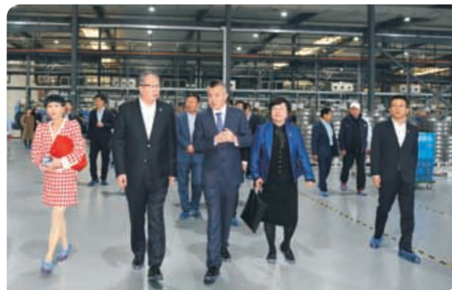
◀ 走访众恒汽车部件有限公司