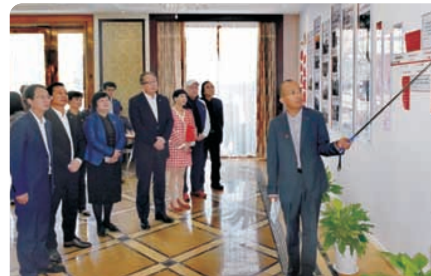
走访浙江南慧控股有限公司 ▶