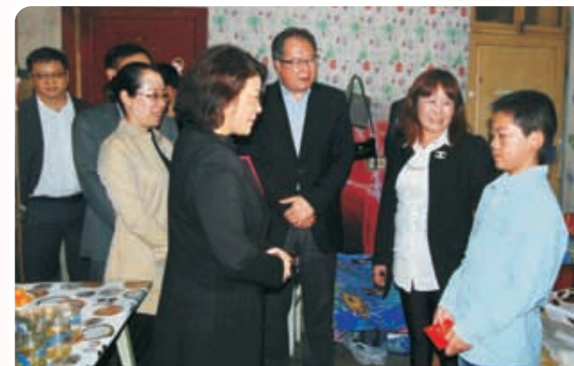
省侨商会在丽水景宁开展“十百千”帮扶活动