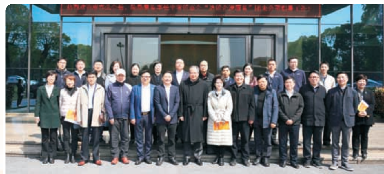
走访硕维控股集团有限公司