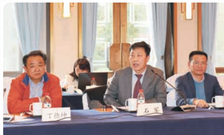
◀ 杭州侨企代表发言