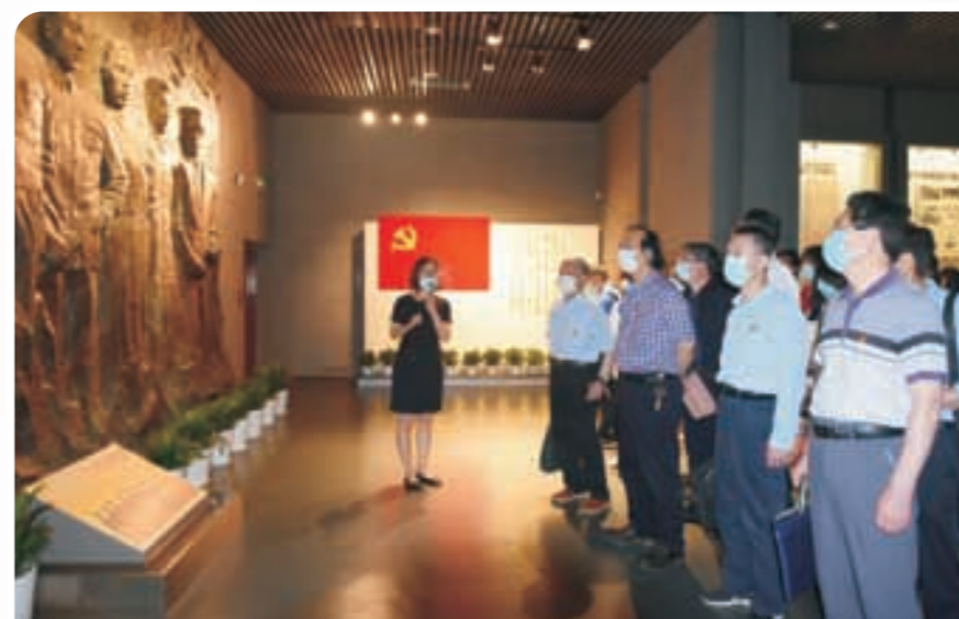
◀ 参观浙江省革命历史纪念馆

开展党史学习活动是对支部全体党员深刻的思想政治洗礼，不仅提升了党性修养和觉悟，而且振奋了精神状态。大家一致表示，革命胜利来之不易，应该更加珍惜当下美好生活，要继承与发扬党的成功经验和优良传统，并付诸行动；要做好本职工作，积极投身侨商组织建设和为侨商、侨企服务工作，为我省打造“重要窗口”建设贡献自己的力量，向建党100周年献礼。 (王丽荣)