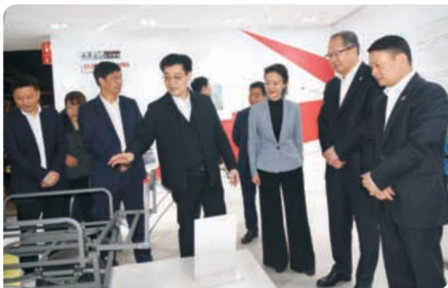
◀ 走访浙江泰普森（控股）集团有限公司